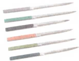
暗紋ペーパーナイフ 漆・握り直塗